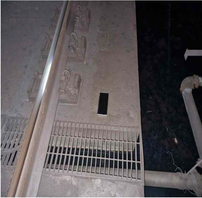
▲선로에 떨어진 유실물(휴대전화)