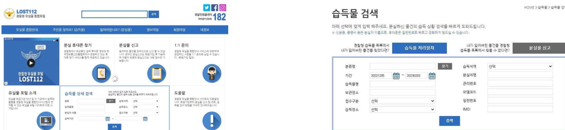
▲ lost112 메인 홈페이지 및 검색 화면